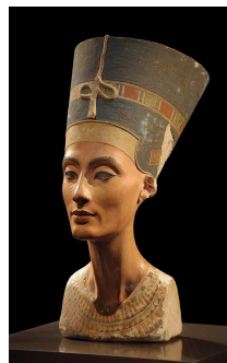
Neues Museum Altes Ägypten Nofretete (Ari~commonswiki)