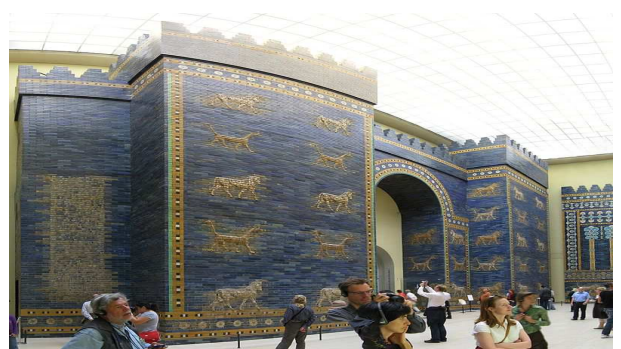
Vorderasiatisches Museum Ishtar-Tor Babylon (Marku)