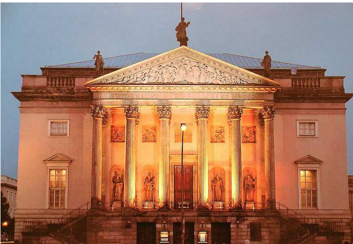
Staatsoper Unter den Linden