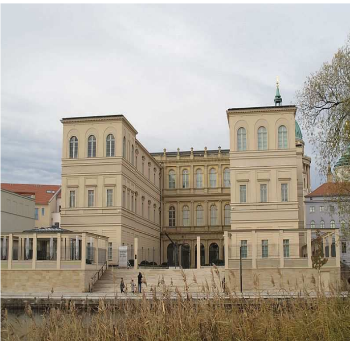
Museum Barberini, Potsdam (Daniel Naber)